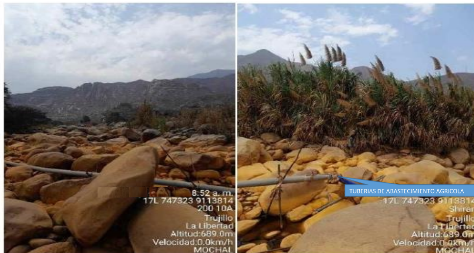
FOTOS DE CAUCE DE RIO, SE APRECIA TUBERIA DE ABASTECIMIENTO AGRICOLA Y BOLONERIA PROPIO DEL RIO A DESCOLMATAR