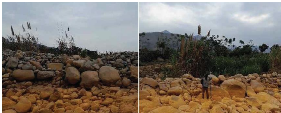
MATERIAL ROCOSO DENTRO DE CAUCE DE RIO